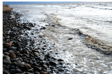
Илл. 4. Места интереса среди туристов в с. Ворзогоры: колодец, шалаш из веток на пляже, магазина (общественный амбар), памятник уроженцам Ворзогор, 40-метровый пригор на берегу Белого моря, архитектурный ансамбль, Белое море. Фото Т. Жигальцовой, 2018 г.