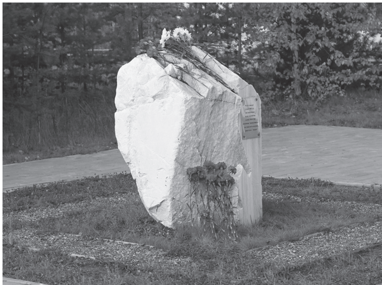
Ил. 4. Памятный знак на месте высадки первого трудового десанта в 1976 г.

случайно: «закладной» камень «первопроходцев» был привязан к историческому месту, а эффектный «Памятник героям-нефтяникам» — к ландшафту. Тем не менее такая локализация памятных знаков часто считается горожанами как «спорный политический момент»: