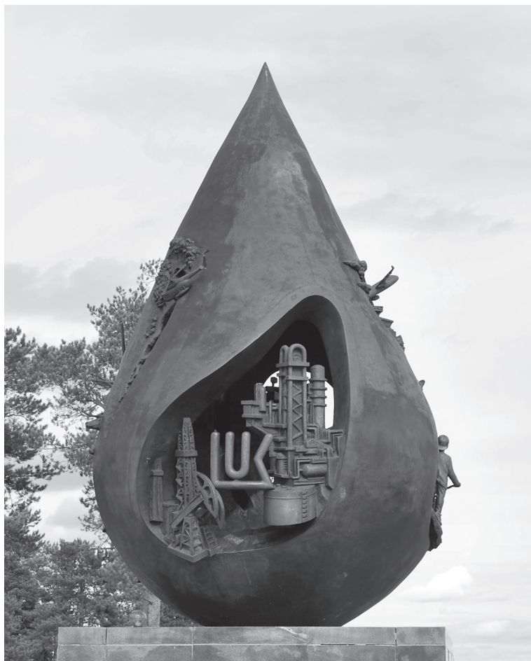
Ил. 3. «Капля жизни»

варе и напротив здания ООО «ЛУКОЙЛ — Западная Сибирь», капля нефти как кольцо всевластия подчиняет себе всю символическую систему города.