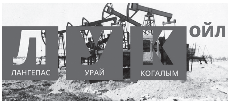
Ил. 1. Логотип ЛУКОЙЛ 1991 г.