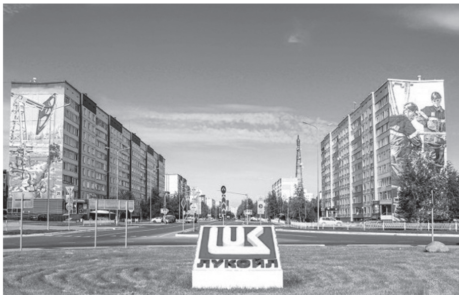
Ил. 2. Стенография.

ства в развитие своего бренда, формирование полноценных бренд-коммуникаций, интеграцию всех типов маркетинговой активности вокруг бренда в единую систему [Спиридонова 2013]. Когалым — важная часть бренда ЛУКОЙЛа. Возможно, это один из самых забрендированных российских городов. Многочисленные знаки корпорации тесно переплетены с городскими местами, что порождает ощущение захваченности города, его подчиненности «нефтепромышленному гиганту» (ил. 2).